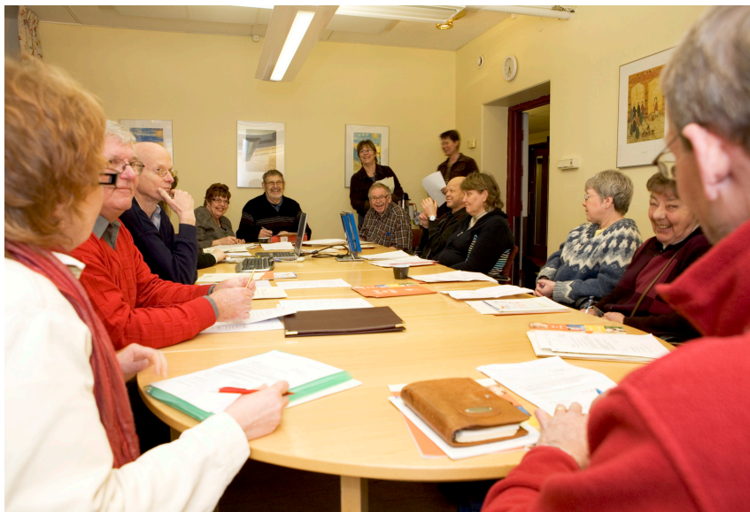
Bildtext ovan: Konferensrummet ger möjlighet till föreningsmöten.